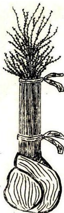
2-р зураг. Суулгацыг хол тээвэрлэхэд боож бэлтгэсэн байдал

7.2 Суулгацыг 50 эсвэл 100 ширхэгээр боож, хаягийг тээвэрлэлтийн үед тасарч гээгдэхээс хамгаалан боодлын гадна ба дотор талд зүүнэ.